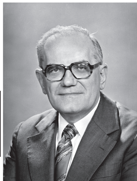
MTI/MTVA Fotóarchívum/Horling Róbert, Bisztray Károly

1921. október 30. Budapest – 2006. június 19. Budapest