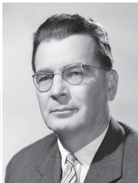
MTI/MTVA Fotóarchívum/Horváth Tamás, Járai Rudolf

1914. május 19. Rákosliget, Pest-Pilis-Solt-Kiskun vármegye – 1982. február 14. Budapest