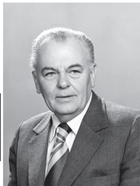
MTI/MTVA Fotóarchívum/Horling Róbert, Bisztray Károly

1922. december 14. Páka, Zala vármegye – 2008. március 12. Budapest