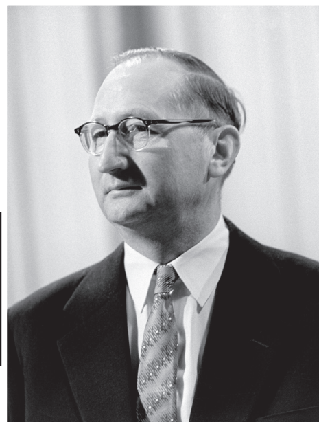
MTI/MTVA Fotóarchívum/Fényes Tamás

1906. augusztus 25. Diósgyőr, Borsod vármegye - 1993. június 29. Budapest